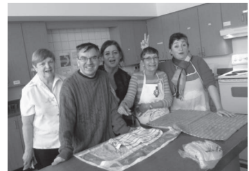
Équipe de la soupe

L'assemblée logement est une activité de vie associative très appréciée des membres, et ce, depuis pratiquement la création de l'organisme, il y a plus de 35 ans. Cette activité a lieu le dernier jeudi de chaque mois. Après avoir partagé la soupe préparée par des bénévoles dévoués à la cause du droit au logement, un temps est consacré à l'éducation populaire autour d'enjeux de défense des droits et de luttes sociales. Il y a également un temps de mobilisation des membres pour les actions collectives à venir. Un sujet différent est présenté chaque mois et les membres ont l'occasion de s'exprimer et de poser des gestes concrets. Cette année, l'activité de mars qui s'intégrait dans le mois de la nutrition a pris la forme d'une assemblée publique, ouverte à toute la population du quartier.