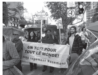
Marche Centraide 02/10/2014