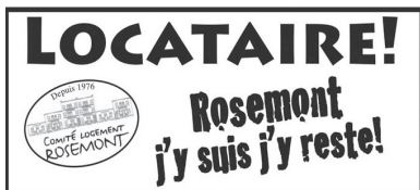
Affichettes contre les reprises et évictions

En décembre 2014, le Comité logement a mené une campagne d'information dans le Vieux-Rosemont, secteur particulièrement affecté par la perte de logements locatifs. Environ 2000 dépliant invitant à communiquer avec nous ont été distribués de porte en porte aux locataires aux prises avec une reprise de possession de leur logement par leur propriétaire. Suite à cette initiative, 37 locataires victimes de