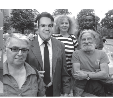
Action du 16/06/2014