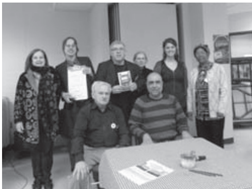
Assemblée publique contre les conversions

Le 2 avril 2014, un groupe de sept membres du Comité, accompagné de la stagiaire en travail social, a invité les résidentEs de Rosemont à s'informer sur les enjeux entourant la gentrification et la conversion des immeubles locatifs en condos. La protection du parc de logements locatifs étant l'une des priorités de l'année, le groupe de militantEs s'est penché sur les moyens à entreprendre pour informer et mobiliser les résidentEs par rapport à cet enjeu. Dans un premier temps, ils et elles avaient distribué plus de 4000 tracts et apposé des affiches invitant la population à cet évènement.