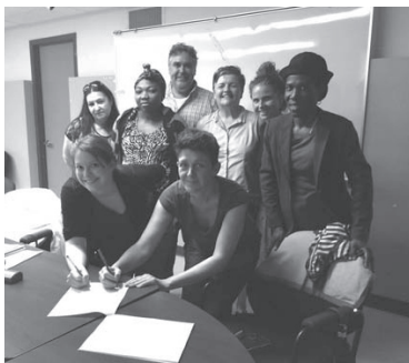
Les membres fondatrices de la coop

Le projet de coopérative Rose-Main a reçu son engagement conditionnel en 2014. Cela signifie que les 60 unités de logement engagées ne sont plus menacées par les coupures dans le financement du programme AccèsLogis. Le noyau fondateur est formé de membres du projet Sur la Main, du Comité logement et de requérantEs issues de la liste de Bâtir son quartier. Ce groupe fondateur se rencontre sur une base mensuelle. Le Comité a soutenu le projet en fournissant des salles pour les rencontres qui sont tenues le soir. Une rencontre pour faire le point sur le processus d'identification des membres fondateurs et fondatrices s'est tenue en mai 2014. Deux représentantEs du