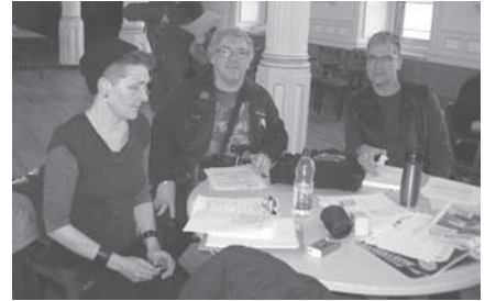
Délégation du CLR à l'AG du FRAPRU, janvier 2015

Les groupes membres du FRAPRU se sont réunis en Assemblée générale 4 fois entre septembre 2014 et mars 2015. Le Comité y a envoyé une délégation de militantEs accompagnée par un administrateur et un salarié du Comité à chaque assemblée. Ces dernières ont servi à préciser le plan d'action voté lors du Congrès tenu en juin 2014.