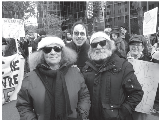
Manifestation unitaire pour dénoncer les mesures d'austérité

Depuis avril 2014, un vent morose et austère souffle sur le Québec. Le Comité a participé activement aux activités organisées par la Coalition opposée à la tarification et à la privatisation des services publics. Deux membres de l'équipe de travail étaient présents à une formation sur les alternatives fiscales. Le nouveau savoir acquis a été partagé avec les membres du Comité lors de l'assemblée logement d'octobre 2014. Plusieurs membres du Comité ont participé à la manifestation du 31 octobre à Montréal ainsi qu'à la semaine d'action tenue en février.