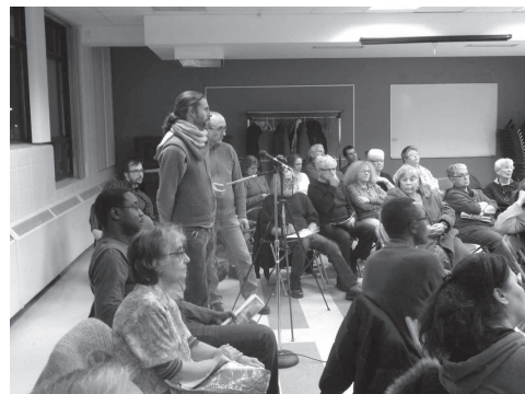
Présentation Dossier noir du logement, 18/11/2015