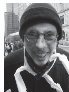
Action du 23/10/2014