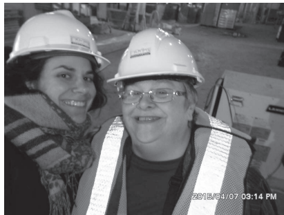
Visite du chantier des Habitations Le Pélican

C'est au courant de l'année 2014-2015 que le projet Pélican aura véritablement pris son envol. Les travaux de construction ont débuté au mois de mai 2014. La durée prévue des travaux est de 16 mois et la livraison de l'immeuble par le promoteur est prévue pour septembre 2015. À partir de ce moment, les premiers et premières locataires pourront investir leur nouveau logement. Le processus de sélection a débuté au mois de novembre 2014. La sélection des locataires des 71 logements du Volet 1 (50 à 65 ans) a été complétée au début du mois de mars 2015. C'est à ce moment que le comité de sélection a commencé à rencontrer dans le cadre d'entrevues les futures locataires du Volet 2 (65 ans et plus) qui compte 108 logements.