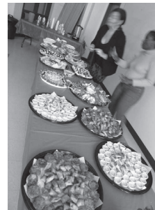
Fête de fin d'année 2014