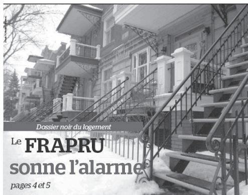
La Une du Journal de Rosemont sur la crise du logement dans le quartier