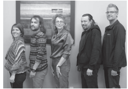
Équipe de travail 2014-2015