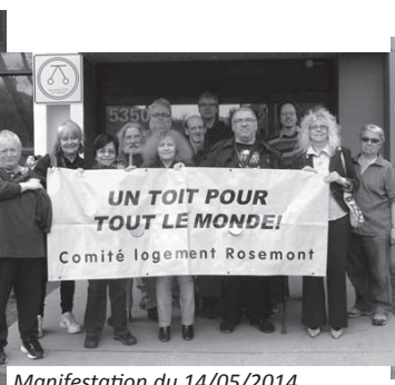
Manifestation du 14/05/2014