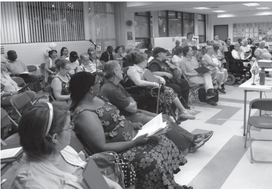
Assemblée générale des membres 2014

70 membres ont participé à l'assemblée générale annuelle tenue le 17 juin 2014.