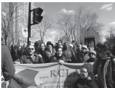
Manifestation du 24/04/2014