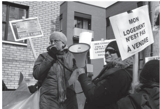
Action contre les conversions, 16/04/2014