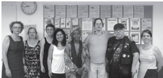
Conseil d'administration 2014-2015

Cette année, les réunions du conseil étaient particulièrement animées avec des échanges soutenus sur les enjeux du droit au logement et des luttes sociales. L'engagement des membres s'est avéré significatif lors de réunions pour donner les orientations à l'équipe de travail en ce qui concerne le plan d'action, mais aussi dans la participation aux activités de l'organisme. Deux membres ont suivi la formation sur les rôles et responsabilités des administrateurs et administratrices.