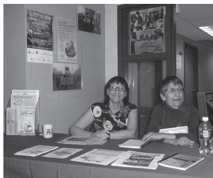
Kiosque, Fête des aînés