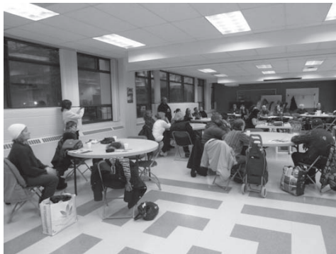
Assemblée publique contre les conversions, 02/04/2014