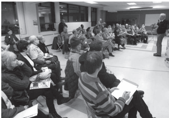
Présentation Dossier noir du logement, 18/11/2015

Cette année, l'enjeu de la gentrification du quartier a retenu notre attention et canalisé nos énergies. Les citoyenNEs ont exprimé le besoin de se documenter pour comprendre le phénomène dont ils et elles ressentent les effets dans leur vie et leur environnement.