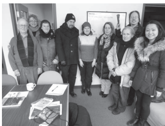
Tintamarre du 12/12/2014