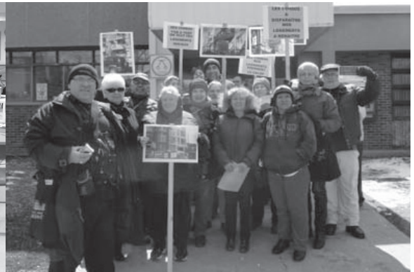
MilitantEs prêtEs à l'action