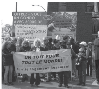
Manifestation du 14/05/2014