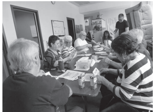
Bénévoles, envoi postal du Baux Fixes

Nous avons commencé à faire l'envoi d'invitations et de rappels d'activités par courriel aux membres internautes. Le Baux Fixes a aussi été envoyé à deux reprises par courriel à une cinquantaine de membres. Les autres ont décidé de conserver la voie téléphonique et la poste pour recevoir les communications du Comité.