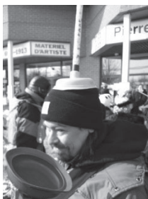
Action du 18/02/2015