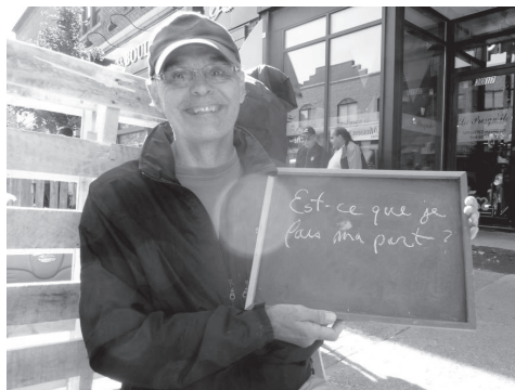
Parking Day, 19/09/2014